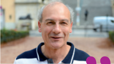
Bruno, Ouest des pentes

En lien avec les étudiants en arts appliqués, nous avons imaginé un nouveau mobilier pour valoriser la place Rouville : des bancs et transats réalisés par un artiste local.