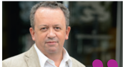
Pascal, Croix-Rousse Ouest

Avec les « petites histoires de la Croix-Rousse », nous avons réactivé les souvenirs des gens du quartier, en les mettant en scène dans une exposition et avec une compagnie de théâtre.